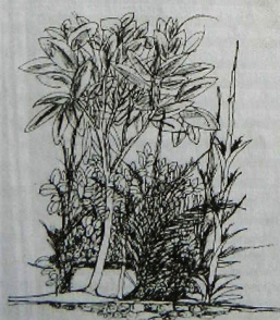
निर्माण : फेब्रुवारी २००९ / ४६

पुण्याची मानसी आणि मूळची चाळीसगावची केतकी, दोघांनीही आपलं पदवीपर्यंतच शिक्षण पूर्ण झाल्यानंतर पुण्या मधल्या इकोलॉजिकल सोसायटीचा 'नॅचरल रिसोर्स मॅनेजमेंट अँड सस्टेनेबल डेव्हलपमेंट' हा एक वर्षाचा कोर्स केला. भारतातल्या वेगवेगळ्या नैसर्गिक परिसंस्था, तिथली जैव-